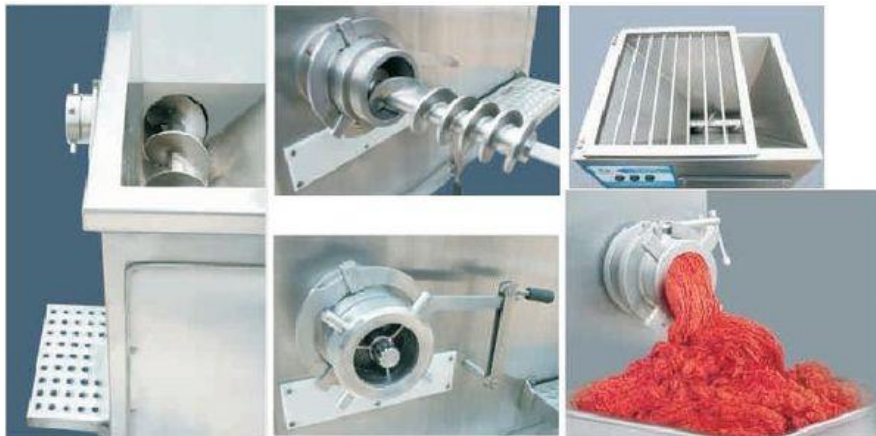
Рис1 Основные элементы

- Спираль шнека выполнена со специально спроектированным переменным шагом, что обеспечивает наиболее оптимальную подачу сырья к режущему узлу, с должным давлением без передавливания и перетирания