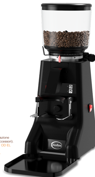
Foto BEST OD EL con regolazione macinatura micrometrica (accessori). The picture shows the BEST OD EL with stepless grind adjustment (special feature).

Voltaggi speciali a richiesta / Other elec. specifications available on request