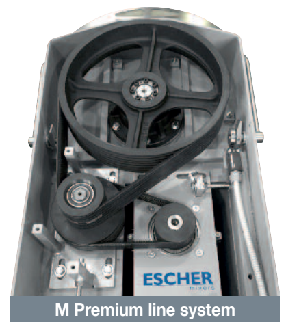
M Premium line system