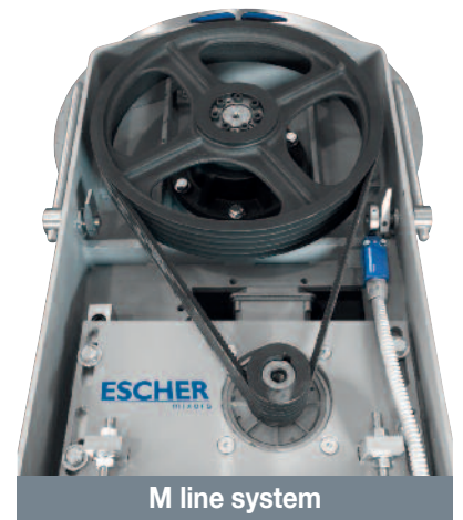
M line system