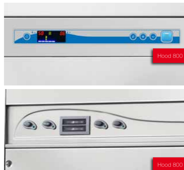
Hood 800 T