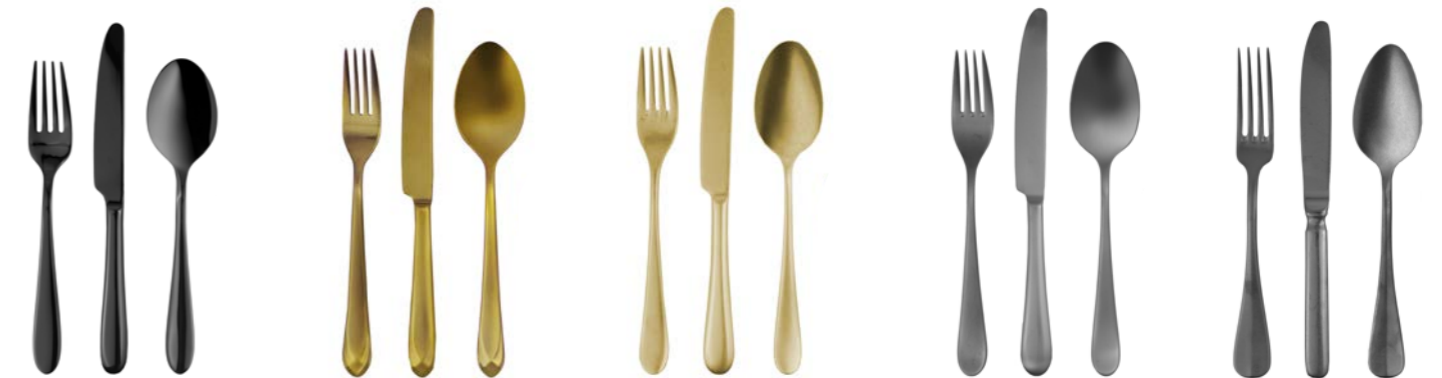
PVD Schwarz PVD black