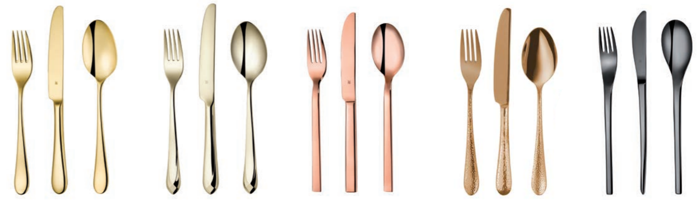
PVD Gold PVD Gold