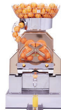
Per uso intensivo

Fantastic F/D Advance Fantastic F/SB Advance