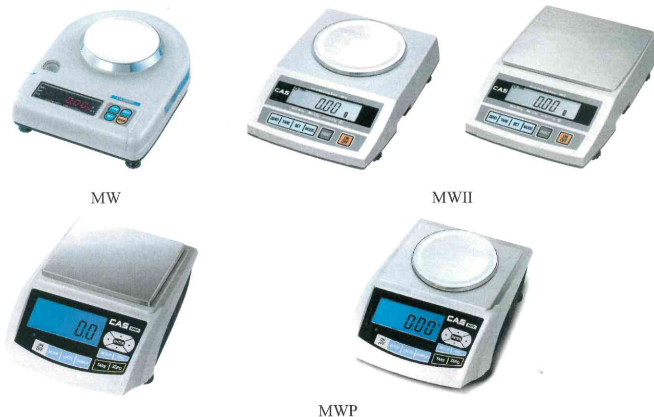
Рисунок 1 - Общий вид весов электронных MW, MWII, MWP

Общий вид весов представлен на рисунке 1.