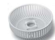
Setaccio con 2 pigne Sieve with 2 reamers