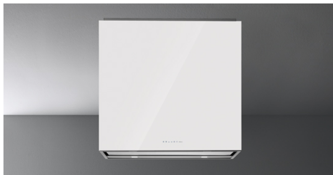
Фотография исключительно для информации Может не соответствовать выбранной версии.