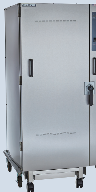
20-20MW С ВКАТЫВАЕМОЙ ТЕЛЕЖКОЙ ДЛЯ ПРОТИВНЕЙ

Размеры, 1898 мм x 888 мм x 1049 мм высота x ширина x глубина