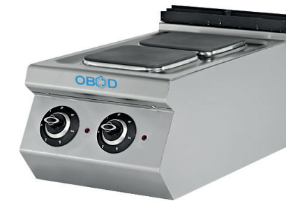
Чугунная плита на 2 конфорки

Профессиональное кухонное оборудование, предназначенное для приготовления первых, вторых и третьих блюд. Плоские прямоугольные чугунные конфорки, плотно прилегающие к друг другу, вместе с двумя боковыми столешницами обеспечивают удобное перемещение посуды по всей поверхности плиты. Максимальная температура конфорок — 480 °С.