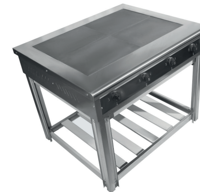
Чугунная плита на 4 конфорок

Мощность: 7кВт Напряжение: 380В Максимальный нагрев: 480С ДхШхВ: 470x860x860 мм