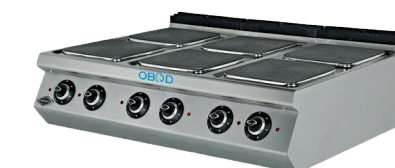
Чугунная плита на 6 конфорок

Мощность: 14кВт Напряжение: 380В Максимальный нагрев: 480С ДхШхВ: 860x860x860 мм