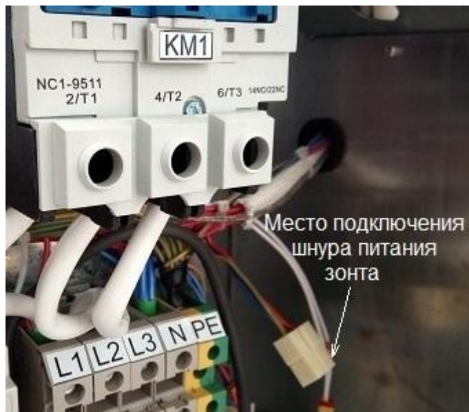
Рис.1 Подключение шнура питания зонта к колодке 45.7373.9005 пароконвектомата

Номинальное поперечное сечение шнура питания не должно быть меньше значений, указанных в таблице 3.