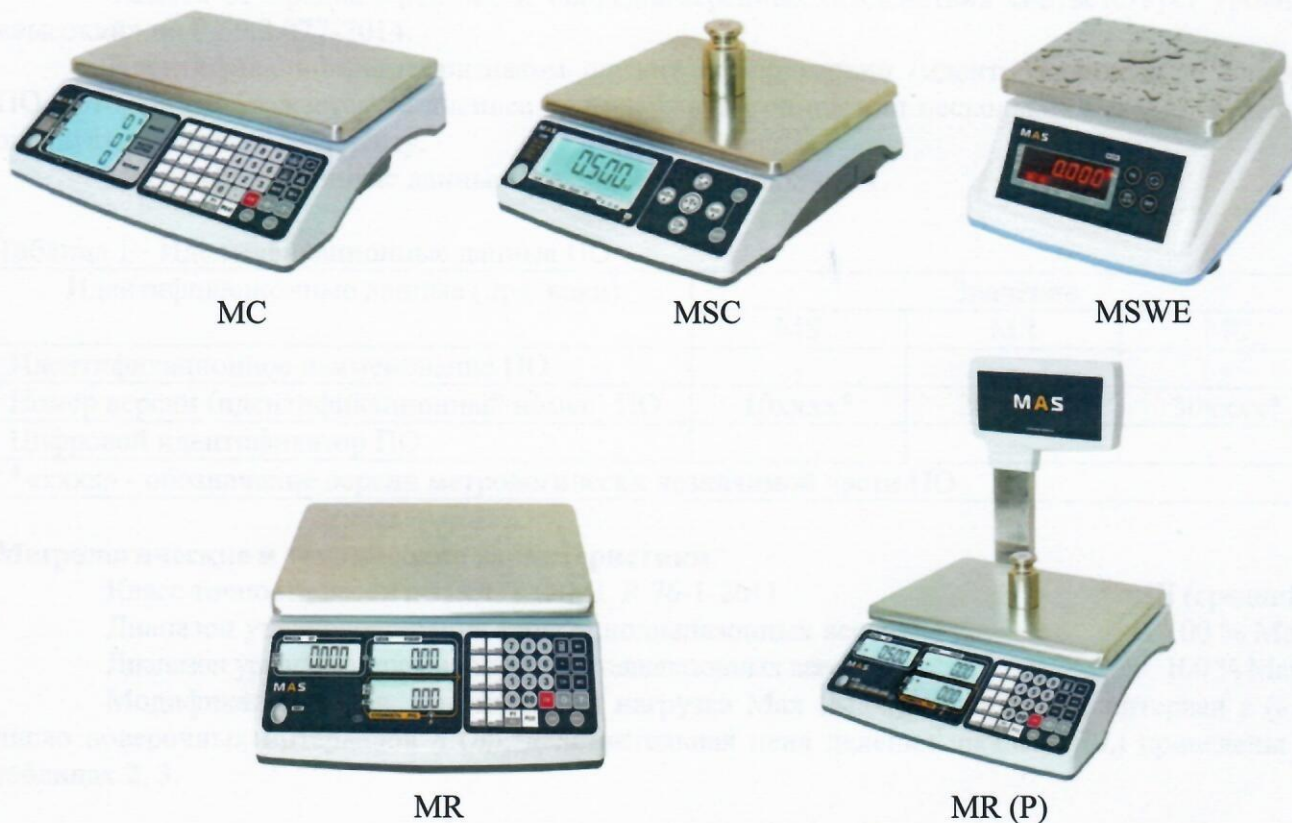
Рисунок 1 - Общий вид модификаций весов