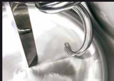
Piantone dritto Straight breaking column