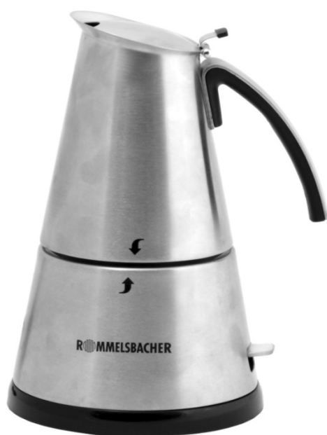
EKO 364/E EKO 366/E