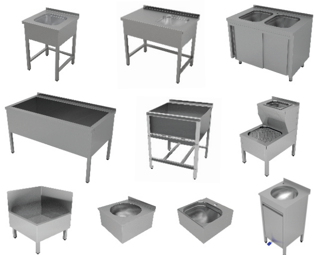
Ванны моечные, котломойки и рукомойники