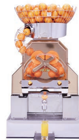
Per uso intensivo

Fantastic F/D Advance Fantastic F/SB Advance