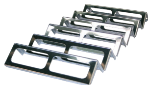
ПОДСТАВКА ДЛЯ БУТЕРБРОДОВ