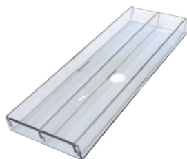
ПОДДОН ДЛЯ МАКАРОНИ (2 СЕКЦИИ)