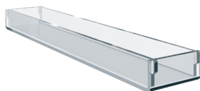
ПОДДОН ДЛЯ МАКАРОНИ (1 СЕКЦИЯ)