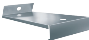
ПОДДОН-ЦЕННИК ДЛЯ МЕЛКОЙ ВЫПЕЧКИ