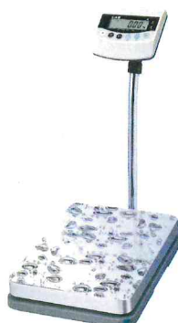
BW (Max=60, 150 кг)