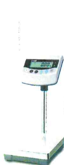
BW (Max=6, 15, 30 кг)