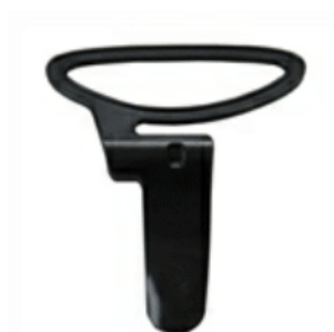
Зажим для брюк