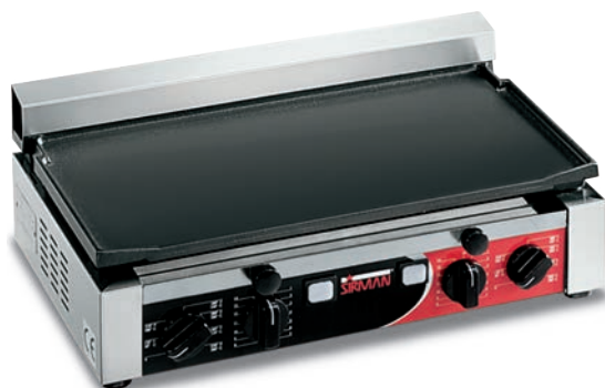
TOP LL TIMER