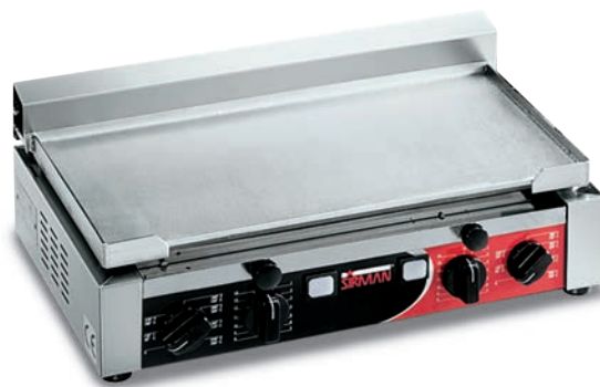
TOP X LL TIMER