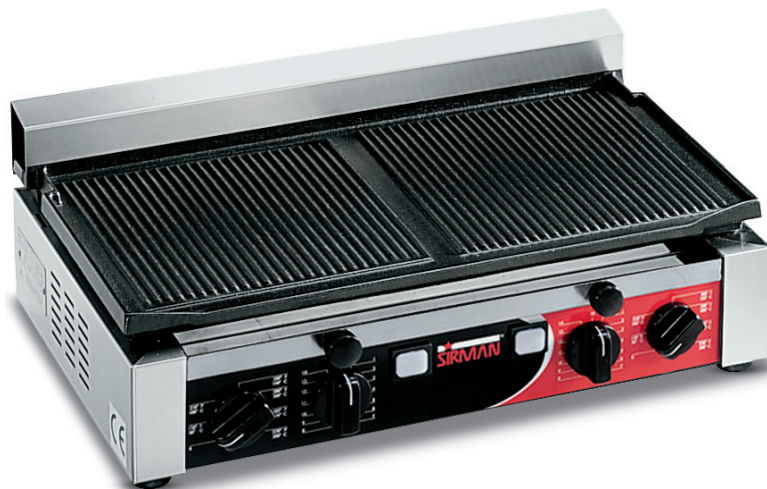
TOP RR TIMER