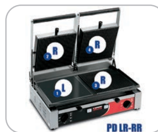
Legenda modelli Models key