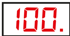
Рисунок 1 Цифровой индикатор пульта управления

Индикатор готовности к работе (прогрева гладильного лотка). При включении гладильного катка и установки необходимой температуры на цифровом индикаторе загорается точка в младшем разряде индикации (см. Рисунок 1), данный символ означает что осуществляется, нагрев гладильного желоба. Когда индикатор погаснет, это означает что гладильный лоток прогрет до заданной температуры и каток готов к работе.