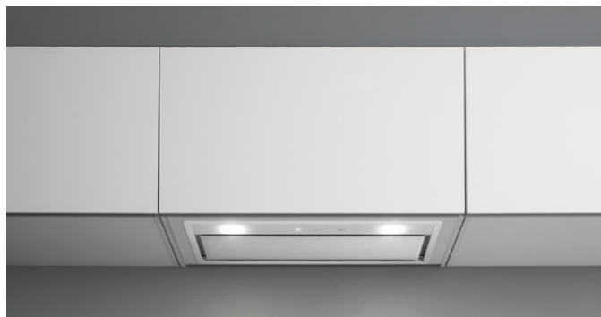
Фотография исключительно для информации Может не соответствовать выбранной версии.

Тип установки Встраиваемые Габаритные размеры 50 см Отделка Painted white steel White glass Мотор 800 м³/h Тип управления Электронное управление Количество скоростей 4 Освещение Led 2x1,2 W - 2700 K / 5600 K Фильтр 2 x Metallic filter "Base" - 204x207 mm Угольный фильтр Round charcoal filter Ø170 mm - Type 6 (Опция) Минимальное расстояние Газовая поверхность: 62 см Электр. поверхность: 52 см