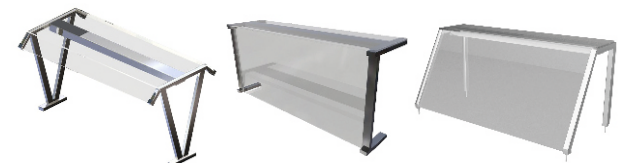
V-образные Г-образные Наклонные

*Изображены три самые популярные модификации