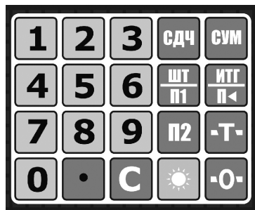
Рис. 3. Клавиатура