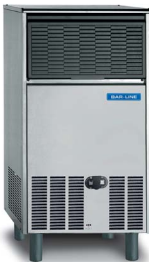
B 7540 AS/WS

La rinnovata gamma di produttori di ghiaccio in cubetti BAR-LINE produce cubetti di forma tronco-conica ad alta efficienza: definiti, limpidi, igienici e robusti per conferire ad ogni bevanda un naturale senso di freschezza.