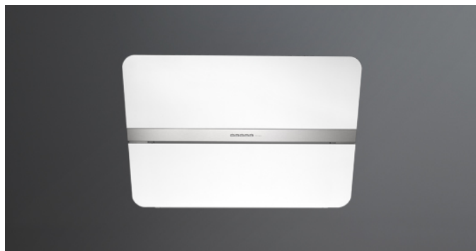
Фотография исключительно для информации Может не соответствовать выбранной версии.