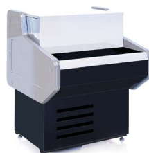
ОCTAVA U KNP КАССОВЫЕ НЕОХЛАЖДАЕМЫЕ ПРИЛАВКИ