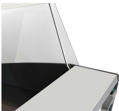
Рабочая и экспозиционная поверхность из нержавеющей стали (в комплектации LX)

Минимальные габаритные размеры позволяют оснастить оборудованием даже самые небольшие торговые пространства. Вместительные охлаждаемые камеры для хранения запасов — конструктивное решение, которое придает высокую функциональность этой модели.