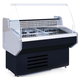
ОCTAVA U M (-15...-13 °C) НИЗКОТЕМПЕРАТУРНЫЕ ВИТРИНЫ