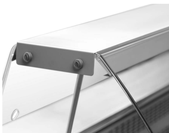
Минимальные габаритные размеры