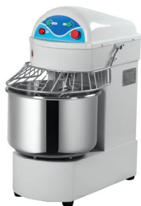
HS 20A/20B/30B/ 40B/50B