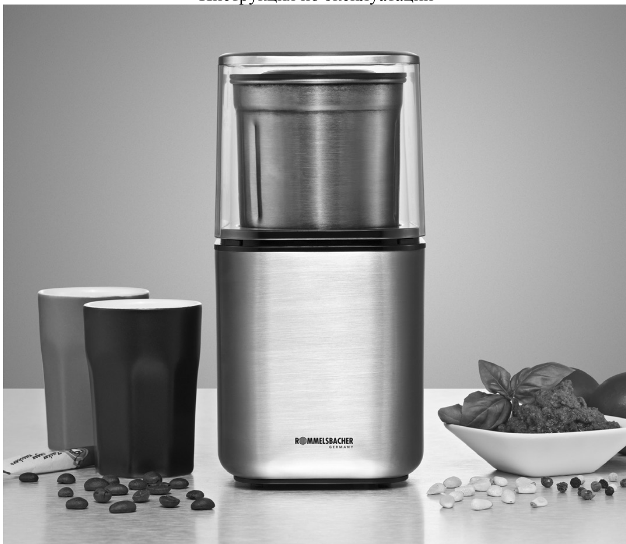
Кофемолка EGK 200